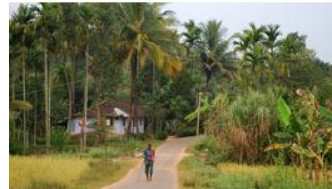
1.11. Fast bist du da. Rings um kleine Dörfer wachsen Arekapalmen, Mangobäume, Zuckerrohr, Bananen, Reis.