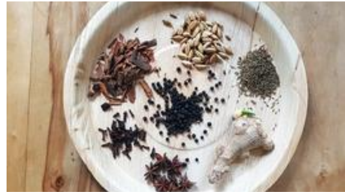
2.2. Gewürze: Zimt, Kardamom, Kreuzkümmel, Ingwer, Anis, Nelken, Pfeffer