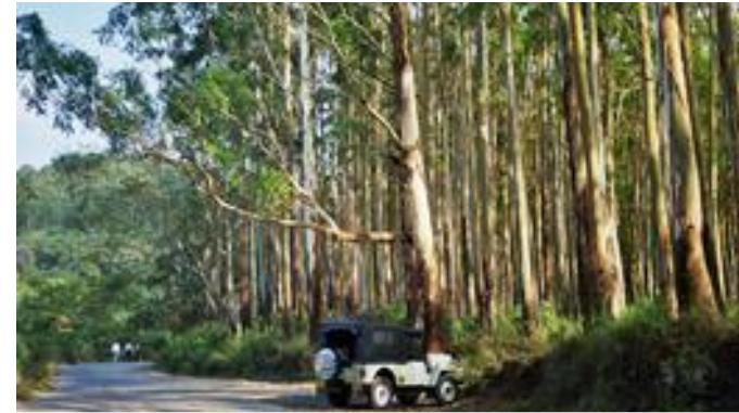
1.9. Was aussieht wie ein Wald, ist keiner, sondern eine Plantage von Eukalyptusbäumen bei Gudalur.