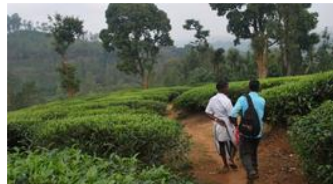
1.10. Von der Kleinstadt Gudalur fährst du weiter auf kleinen Straßen. Jetzt musst du durch Teeplantagen laufen.