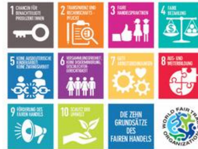
Abbildung 3.9: Grundsätze des Fairen Handels (WFTO)