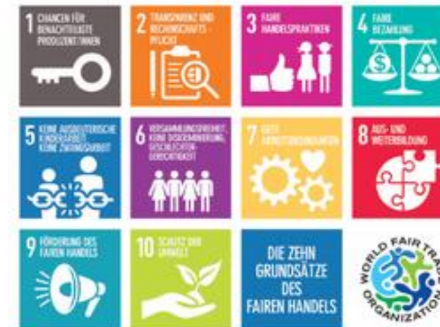
links: Grundsätze des Fairen Handels (WFTO) rechts: Adivasi auf ihrem Land in den Nilgiris-Bergen (AMS)

Wenn Sie das Material als Heft falten möchten, stellen wir Ihnen eine entsprechende Druckvorlage zur Verfügung.