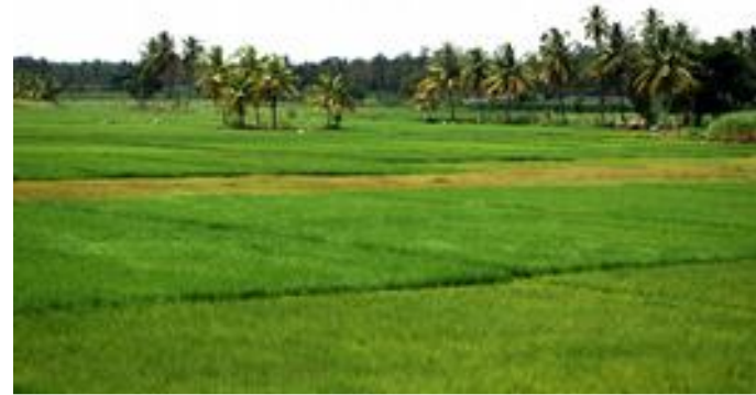
1.5. Auf deiner Fahrt durch das flache Landesinnere kommst du an vielen Reisfeldern vorbei.