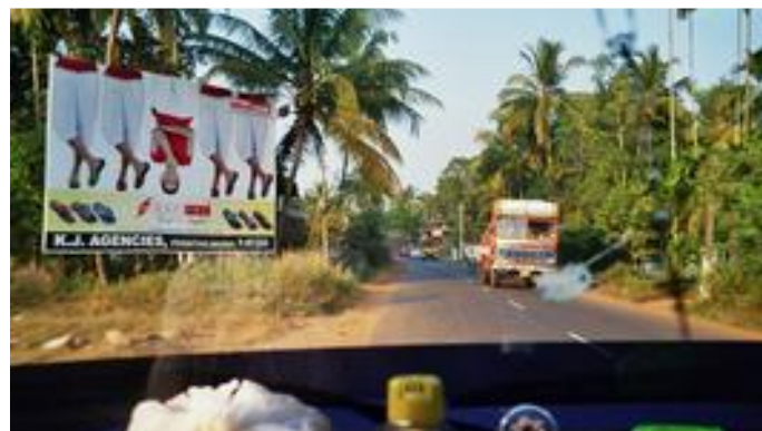
1.4. Die flache Landschaft ist geprägt von Landwirtschaft, unter anderem von Kokospalmen und Arekapalmen.