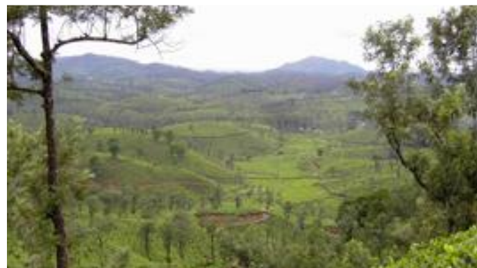
1.8. Große Gebiete wurden seit 150 Jahren abgeholzt für den Teeanbau, den wichtigsten Wirtschaftszweig hier.