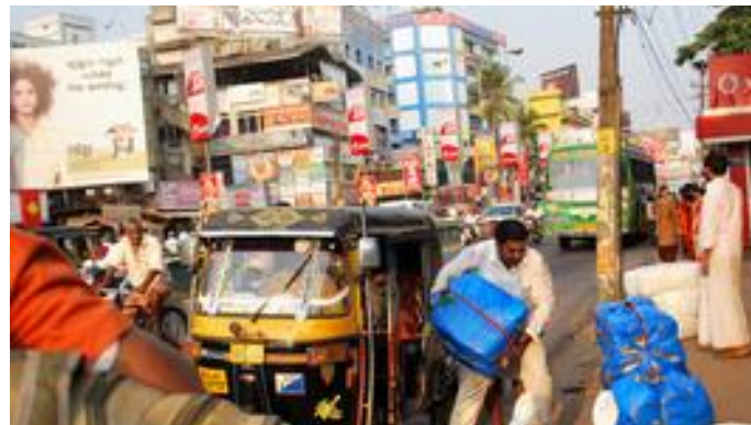
1.3. In Kozhikode ebenso wie in Nilambur und anderen Städten an der Strecke herrscht reger Handel.