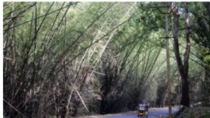
1.7. Ein Wechselspiel zwischen Grasland und Wald ist typisch für die Region. Hier fährst du durch Bambuswald.