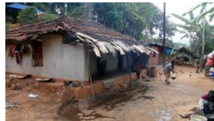
1.12. Herzlich willkommen in einem von über 300 Dörfern der Region, in denen vor allem Adivasi leben.