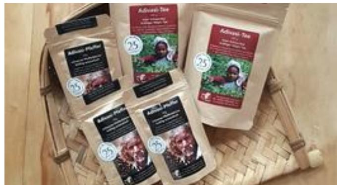
2.3. fair gehandelte Adivasi-Produkte: Tee und Pfeffer