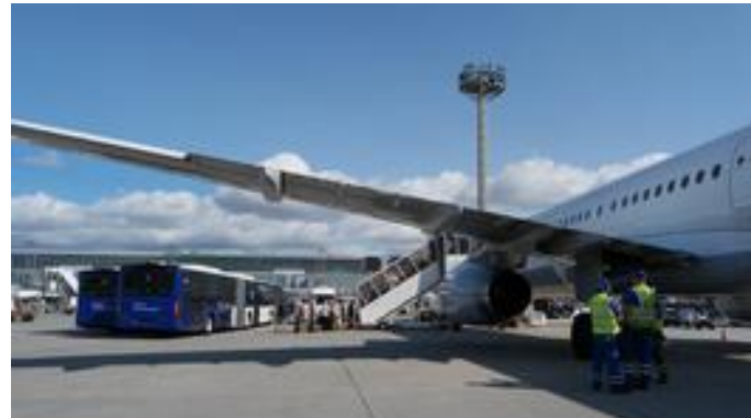
1.1. Du fliegst nach Kozhikode (430.000 Menschen) in Südindien. Die meisten Produkte reisen mit Containerschiffen.