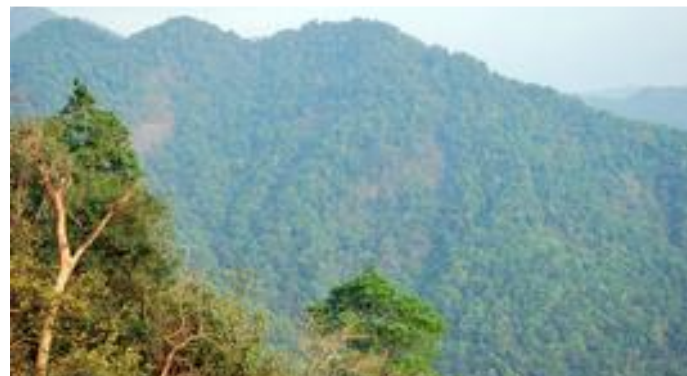
1.6. Du gelangst in die Nilgiris-Berge mit bis zu 2.600 m Höhe. Autos, Busse und Lastwagen winden sich bergauf.