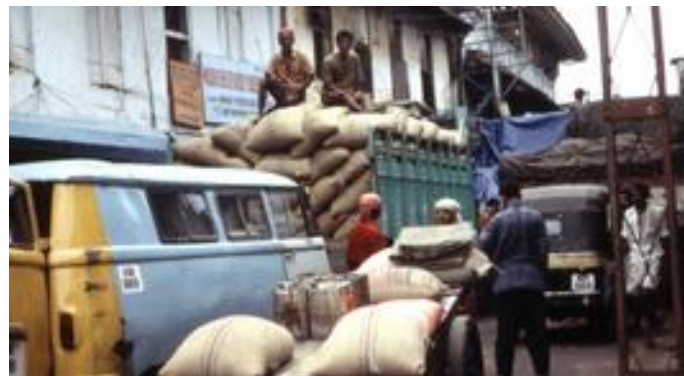
1.2. In den Hafenvierteln herrscht geschäftiges Treiben beim Umladen vielfältiger Produkte.