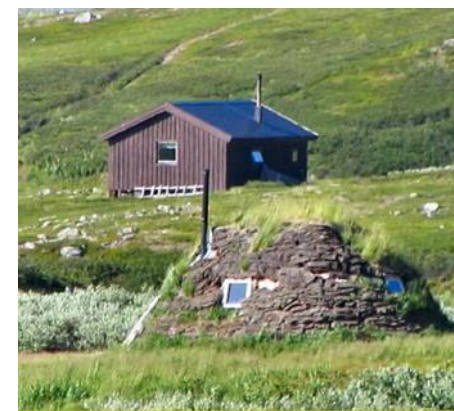
Samen im Norden Scandinaviens

Tipp: externer Link für die Weiterarbeit: Gesellschaft für bedrohte Völker: www.gfbv.de