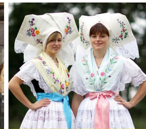
Sorben in Deutschland (Lausitz)