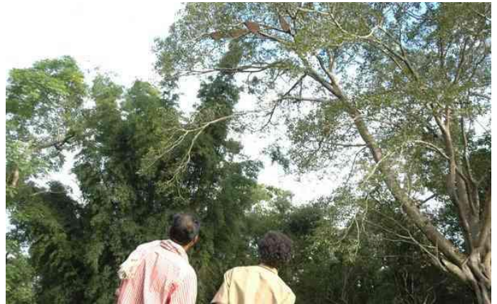
3.6. Adivasi-Männer entdecken Bienennester.