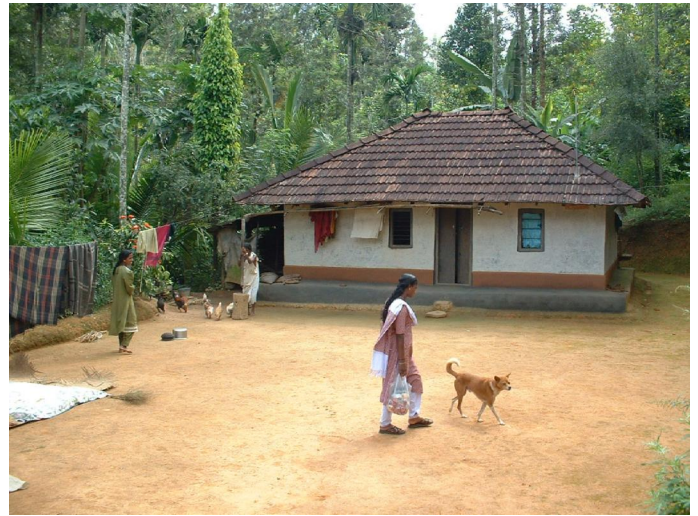
2.2. Haus aus Bambus, Lehm und Ziegeln