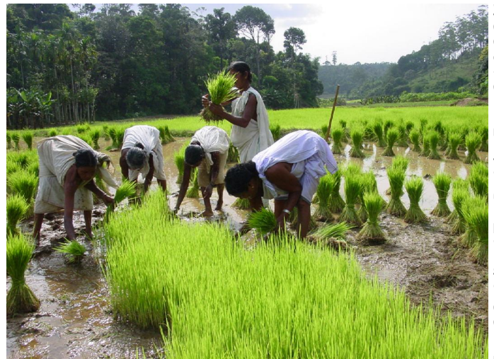
2.6. Umpflanzen junger Reispflanzen

Foto 2.2: Adivasi-Tee-Projekt. Fotos 2.1 & 2.3 bis 2.6: Adivasi Munnetra Sangam