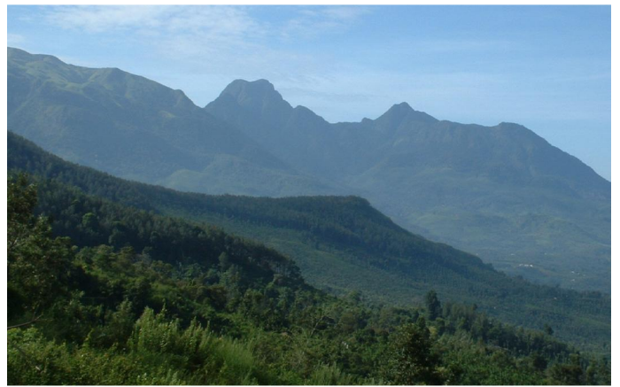
4. Die Nilgiri-Berge sind 250 m bis 2.650 m hoch.