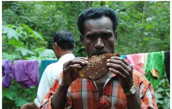
3.7. Ein Adivasi-Mann mit einem Stück Bienenwabe.