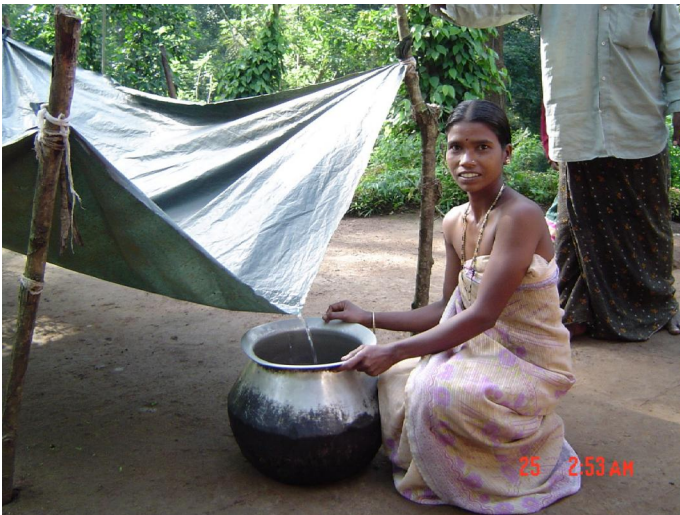
2.3. Auffangen von Regenwasser