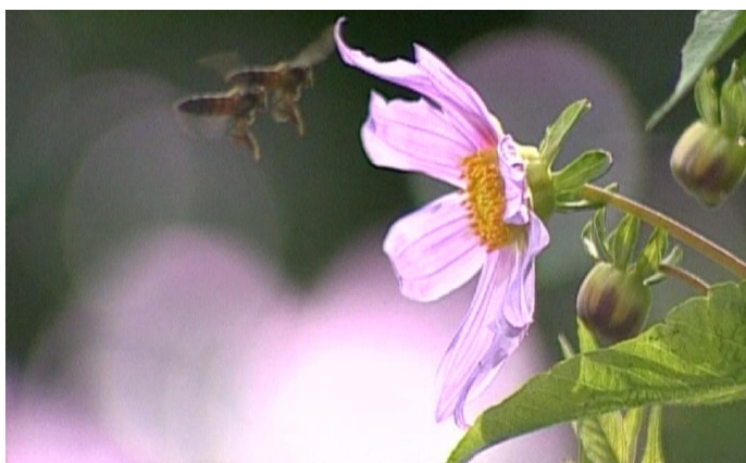
3.3. Riesenhonigbiene ( Apis dorsata ) bestäubt eine Blüte