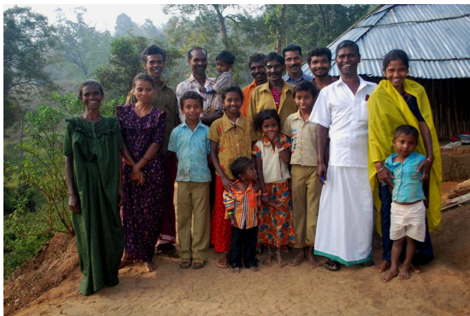
9. Adivasi sind die Ureinwohner/innen der Nilgiri-Berge.