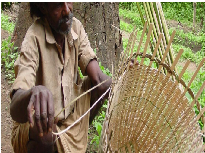
2.5. Herstellen eines Korbes aus Bambus