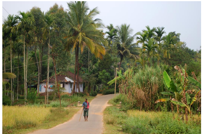
6. In den Tälern leben die Menschen von Landwirtschaft.