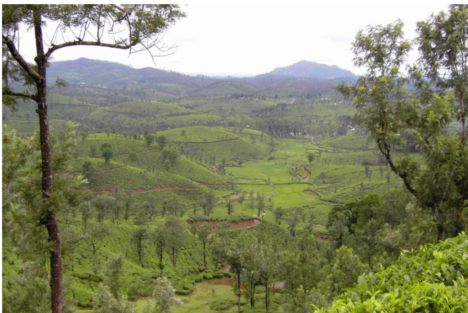
5. Die Nilgiri-Berge sind ein wichtiges Teeanbaugebiet.