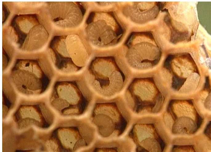
3.4. Larven der Riesenhonigbiene ( Apis dorsata ) in ihren Brutzellen