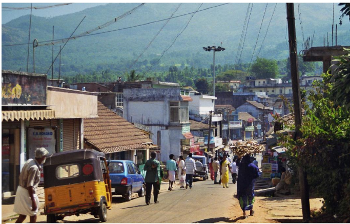
3. Du erreichst Gudalur in den Nilgiris (50.000 Menschen).