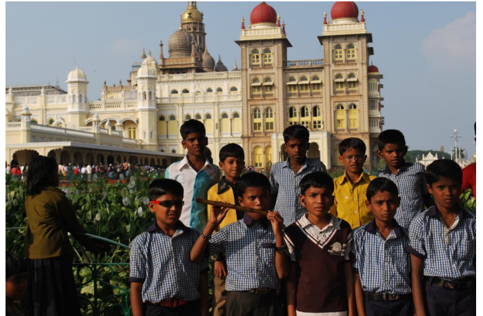
2. Du reist weiter nach Mysore (900.000 Menschen).