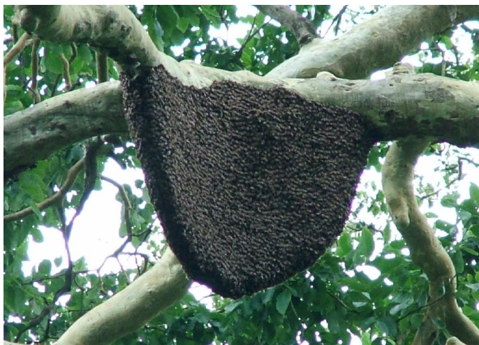
3.1. Nest der Riesenhonigbiene ( Apis dorsata ) an einem Ast in den südindischen Nilgiri-Bergen