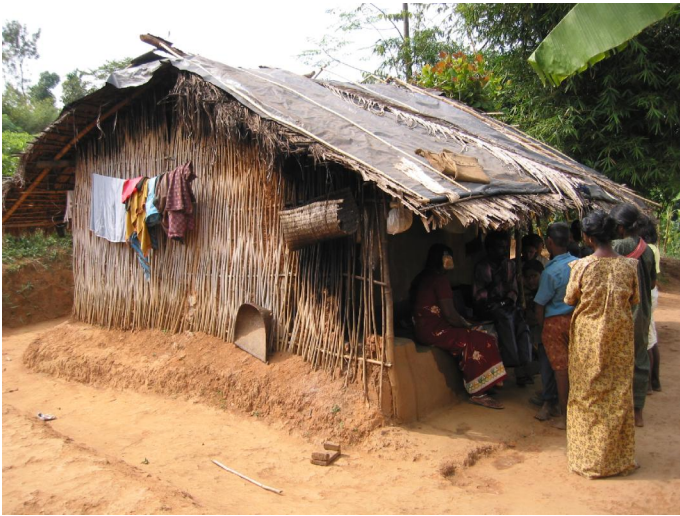
2.1. Haus aus Bambus, Lehm, Gras, Palmwedeln