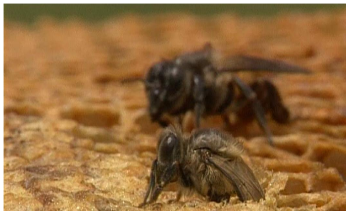
3.5. Erwachsene Riesenhonigbienen ( Apis dorsata ) schlüpfen aus ihren Brutzellen