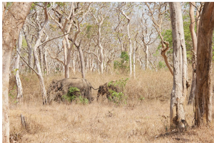
8. In den Nilgiri-Bergen leben etwa 5.200 Elefanten.