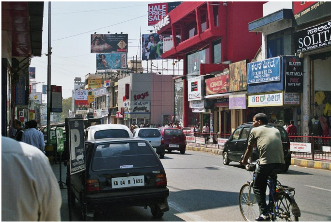
1. Du reist in die Großstadt Bangalore (8,5 Mill. Menschen)