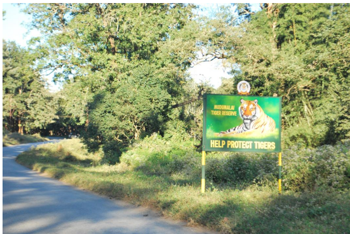
7. Die noch erhaltenen Wälder mit ihrer reichen Tierwelt sind geschützt.