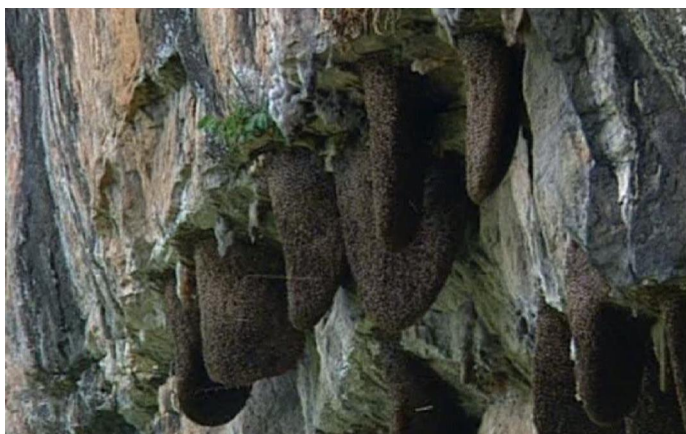
3.2. Nester der Riesenhonigbiene ( Apis dorsata ) an Felsklippen in den südindischen Nilgiri-Bergen