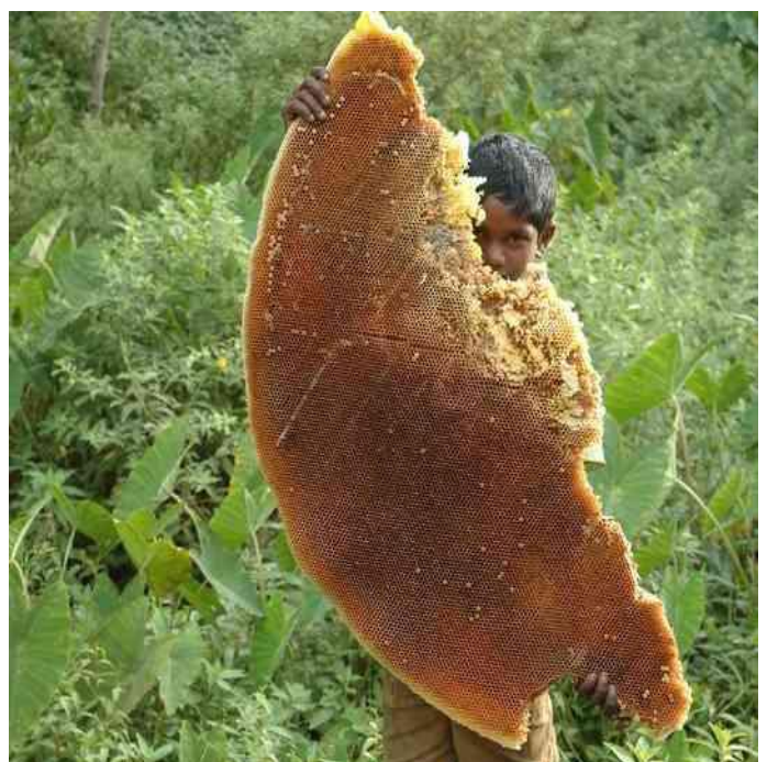
3.8. Ein Adivasi-Junge mit einer Bienenwabe.