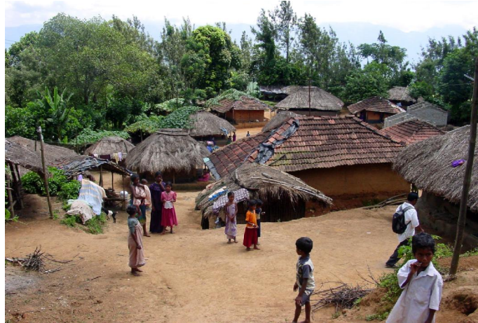
10. Dieses traditionelle Adivasi-Dorf ist von Wald umgeben.