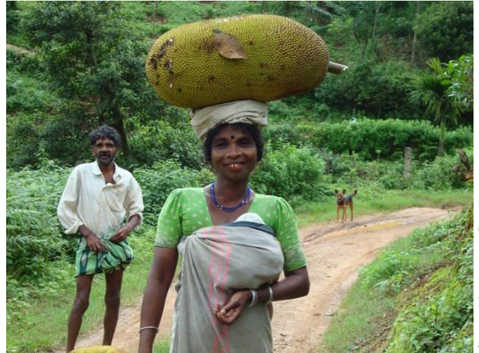
2.4. Adivasi ernteten eine wilde Jackfrucht im Wald.