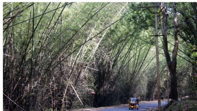
1.7. Ein Wechselspiel zwischen Grasland und Wald ist typisch für die Region. Hier fährst du durch Bambuswald.