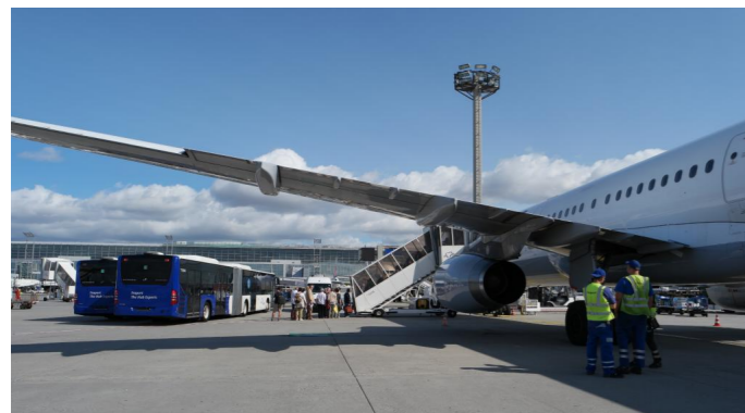
1.1. Du fliegst nach Kozhikode (430.000 Menschen) in Südindien. Die meisten Produkte reisen mit Containerschiffen.