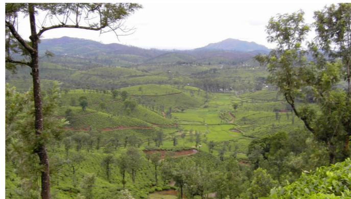
1.8. Große Gebiete wurden seit 150 Jahren abgeholzt für den Teeanbau, den wichtigsten Wirtschaftszweig hier.