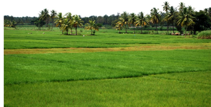
1.5. Auf deiner Fahrt durch das flache Landesinnere kommst du an vielen Reisfeldern vorbei.