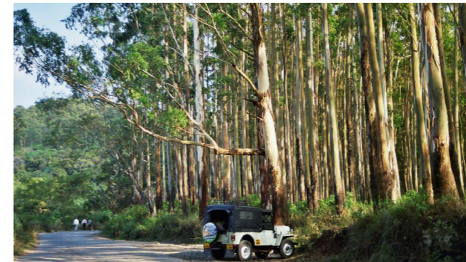
1.9. Was aussieht wie ein Wald, ist keiner, sondern eine Plantage von Eukalyptusbäumen bei Gudalur.