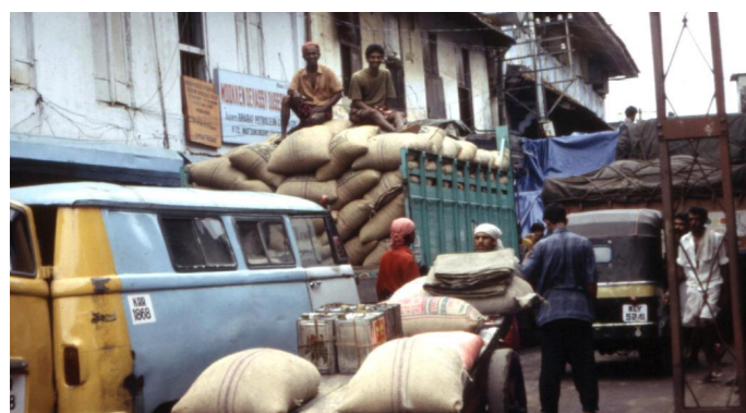
1.2. In den Hafenvierteln herrscht geschäftiges Treiben beim Umladen vielfältiger Produkte.