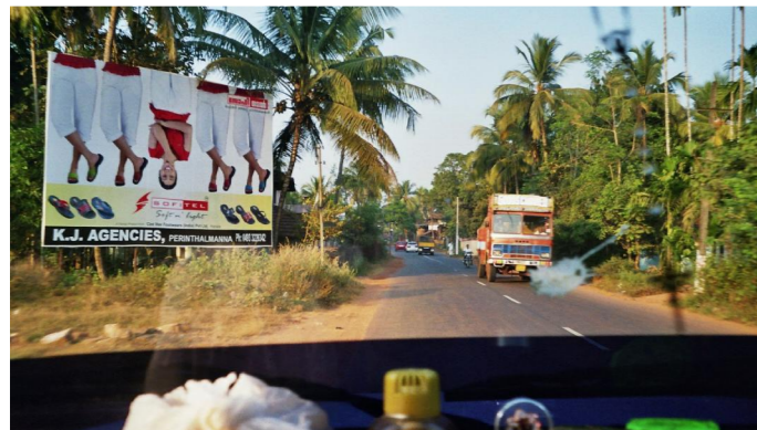
1.4. Die flache Landschaft ist geprägt von Landwirtschaft, unter anderem von Kokospalmen und Arekapalmen.