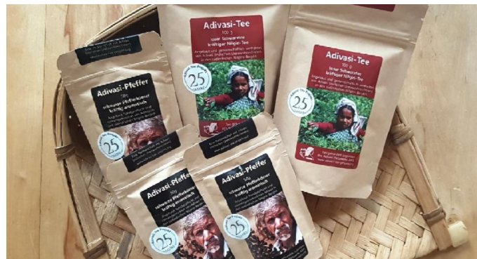
2.3. fair gehandelte Adivasi-Produkte: Tee und Pfeffer