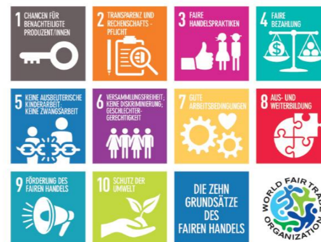
links: Grundsätze des Fairen Handels (WFTO) rechts: Adivasi auf ihrem Land in den Nilgiri-Bergen (AMS)