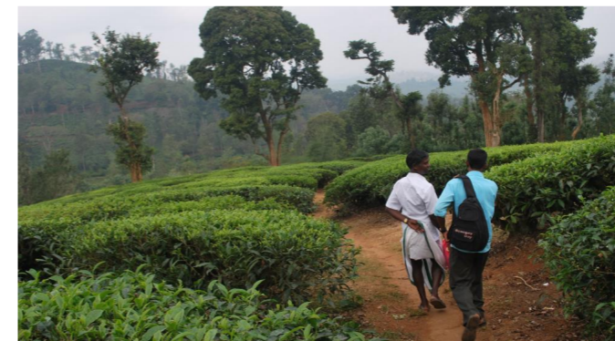
1.10. Von der Kleinstadt Gudalur fährst du weiter auf kleinen Straßen. Jetzt musst du durch Teeplantagen laufen.