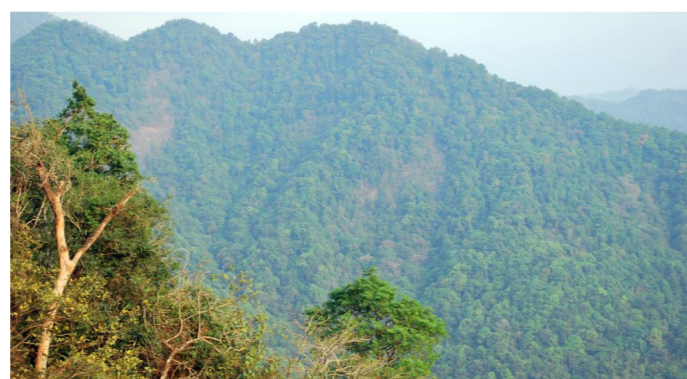
1.6. Du gelangst in die Nilgiri-Berge mit bis zu 2.600 m Höhe. Autos, Busse und Lastwagen winden sich bergauf.