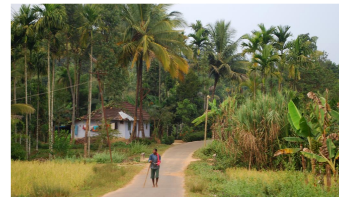
1.11. Fast bist du da. Rings um kleine Dörfer wachsen Arekapalmen, Mangobäume, Zuckerrohr, Bananen, Reis.