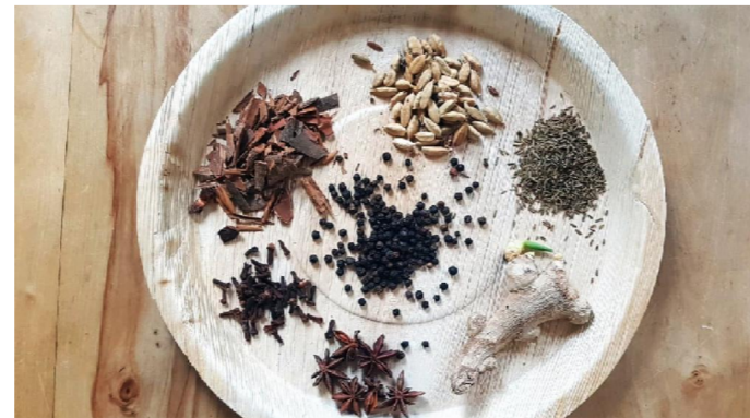
2.2. Gewürze: Zimt, Kardamom, Kreuzkümmel, Ingwer, Anis, Nelken, Pfeffer