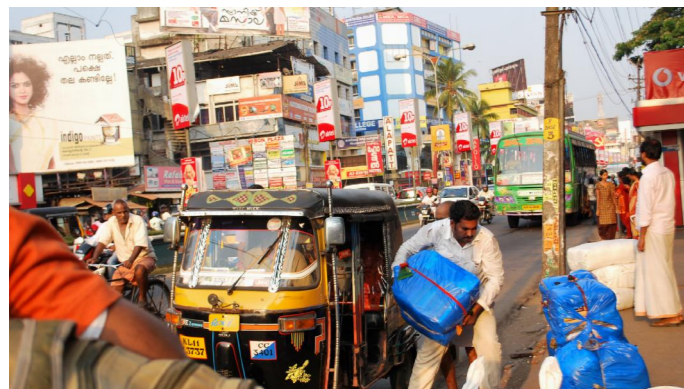
1.3. In Kozhikode ebenso wie in Nilambur und anderen Städten an der Strecke herrscht reger Handel.