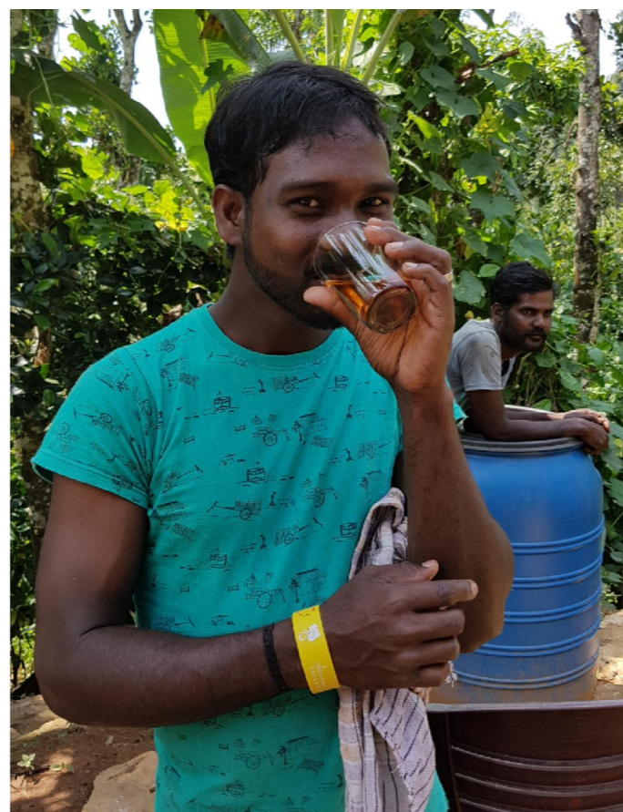
Foto: Ein Adivasi in den Nilgiri-Bergen beim Teetinken (Adivasi-Tee-Projekt)

Schwarztee in der Tasse oder im Krug wie gewohnt mit heißem Wasser aufgießen. Nach Geschmack den Tee mit Apfelsaft (aus regionalem Anbau) je zur Hälfte mischen – mindestens jedoch im Verhältnis 5:1. Pro 1 Liter Eistee den Saft einer viertel Zitrone hinzugeben. Abkühlen lassen, bevor der Tee in den Kühlschrank gestellt wird, sonst wird er trüb. Beim Kühlen mit Eis etwas mehr Teepulver verwenden. Zum Süßen (Rohr-)Zucker (5 bis 10 Teelöffel je Liter) oder Honig in den heißen Tee oder Sirup in den kalten Tee geben. In den Kühlschrank stellen und kühl genießen.