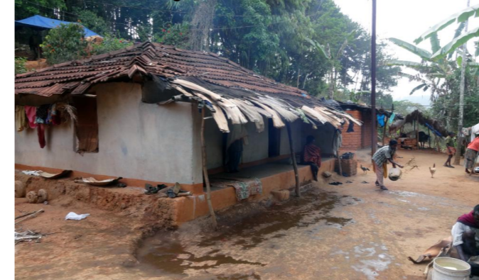
1.12. Herzlich willkommen in einem von über 300 Dörfern der Region, in denen vor allem Adivasi leben.